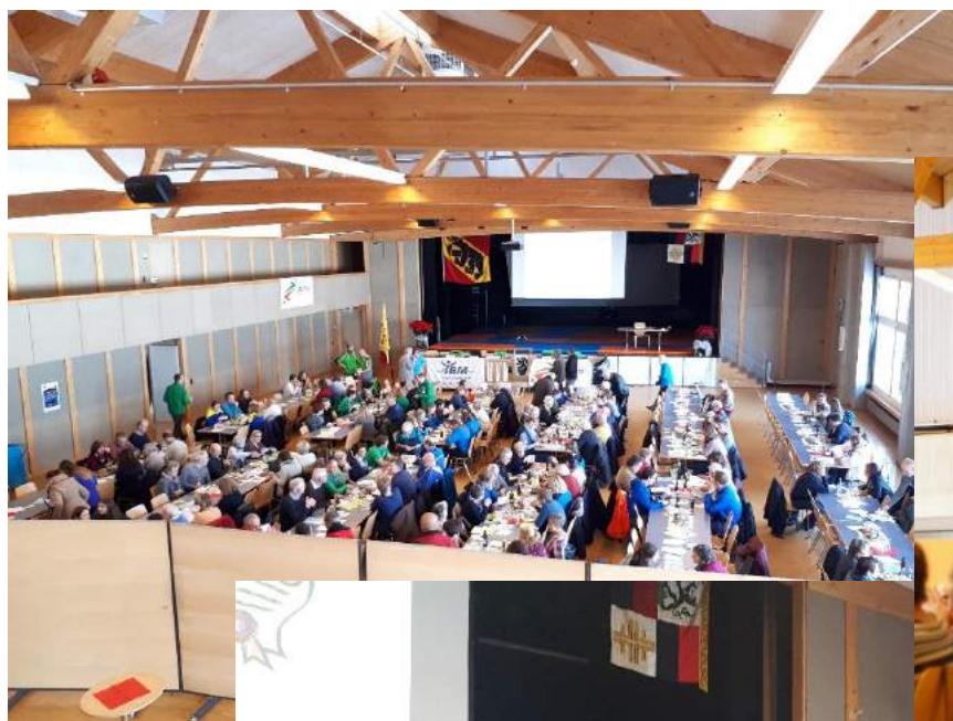
Der Saal füllt sich