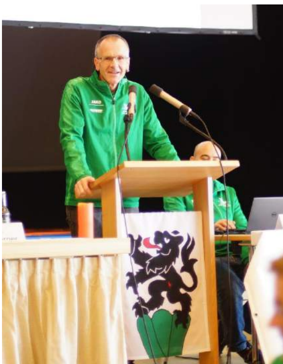
Der Verbandspräsident führt durch die Versammlung