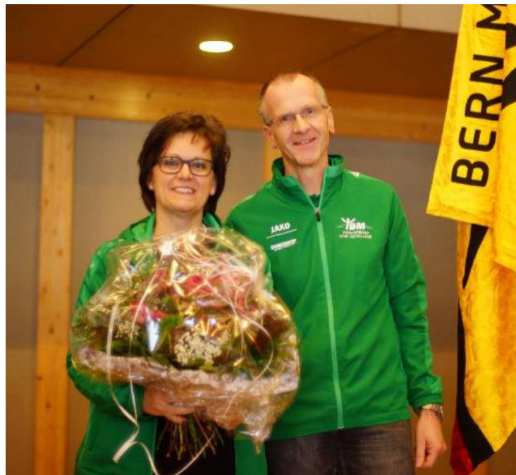
Unser neues Ehrenmitglied