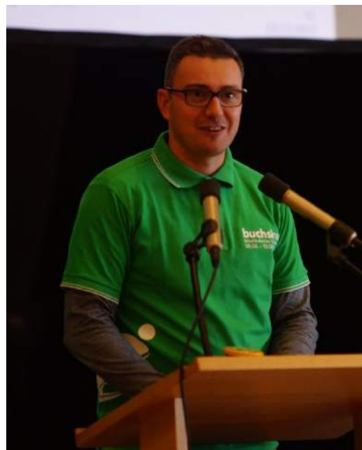
Ein neues Mitglied für den Vorstand

Geschäftsstelle Oberfeldstrasse 5, 3507 Biglen