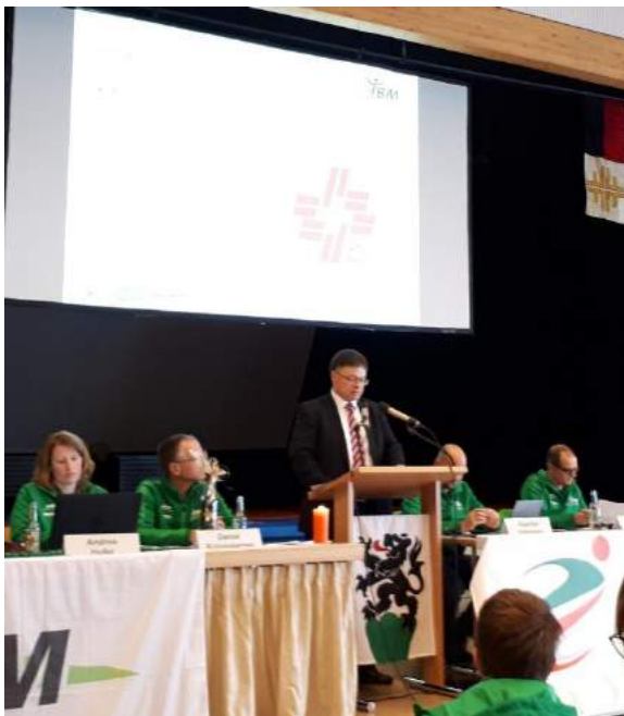
Grüsse aus dem STV werden überbracht