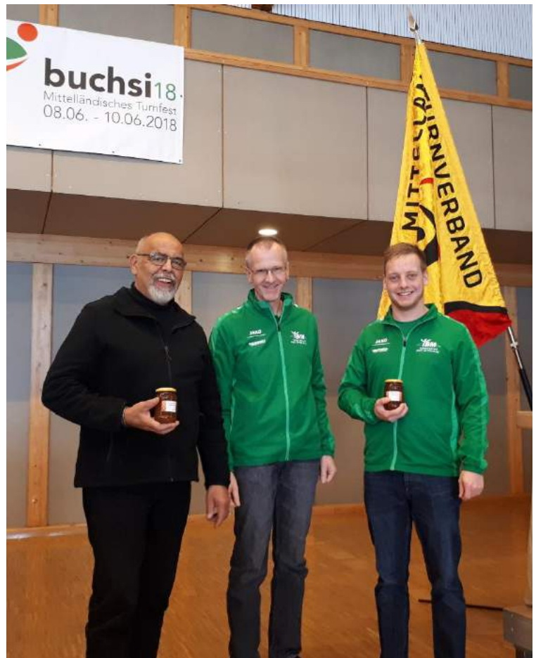
Unsere neuen Mitarbeitenden