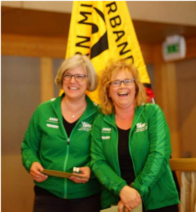
Ehrung für 10jährige Verbandsarbeit