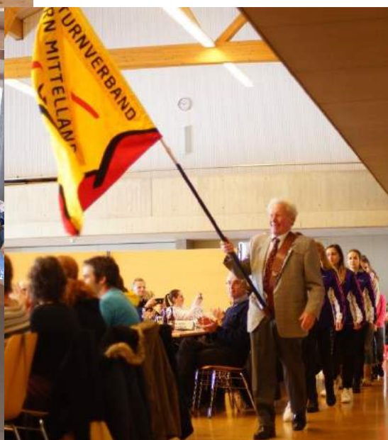
Einmarsch mit der Fahne