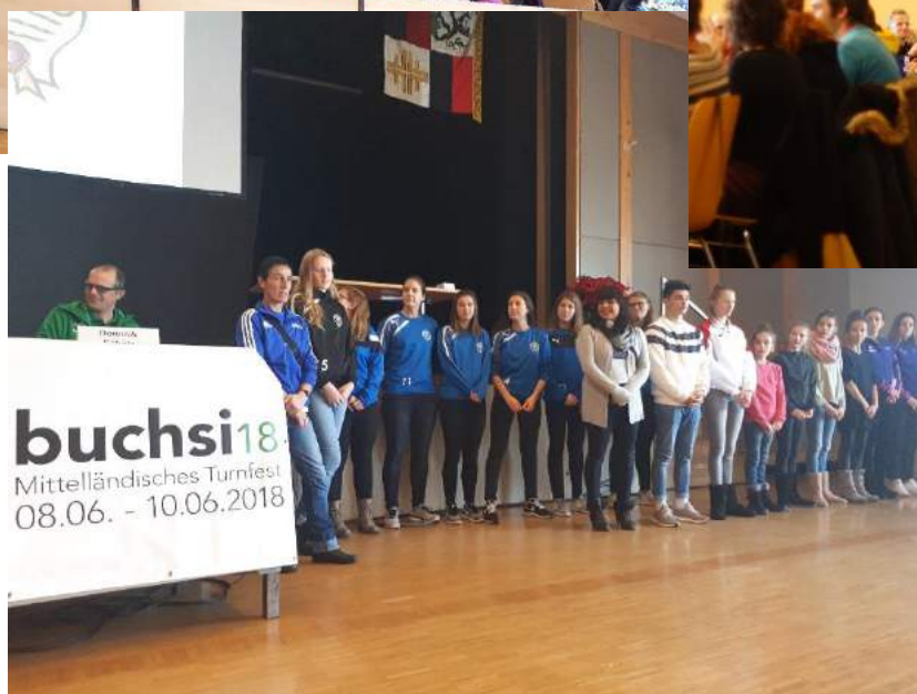
Die geehrten Sportler/innen