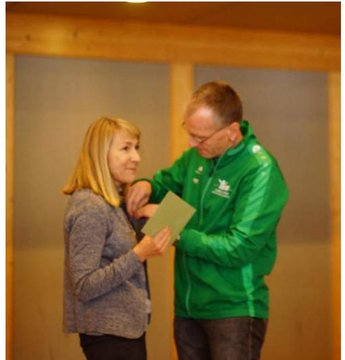
Die Ehrennadel wird überreicht