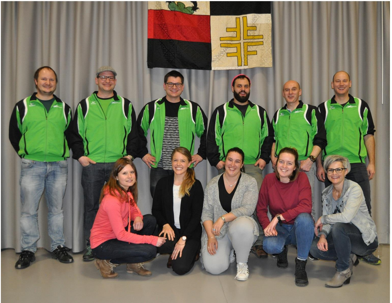
Neuer Vorstand Turnverein Schwarzenburg